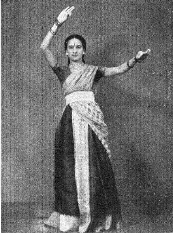
कथक नृत्यपद्धति [ ' कथक नृत्य ' ]